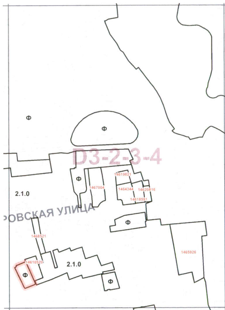
Схема границ подготовки проекта внесения изменений в правила землепользования и застройки города Москвы в отношении территории по адресу: Юровская ул., вл. 42, (кад. №№ 77:08:0001006:3080; 77:08:0001006:3081), СЗАО